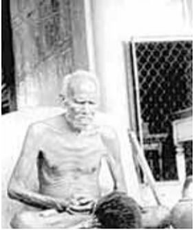
साहित्य मनीषी आचार्य प्रवर श्री ज्ञानसागर जी महाराज

52 वर्षों के पश्चात हो रहा आचार्य पद प्रतिष्ठापन, देश-विदेश से देखने आ रहे लोग